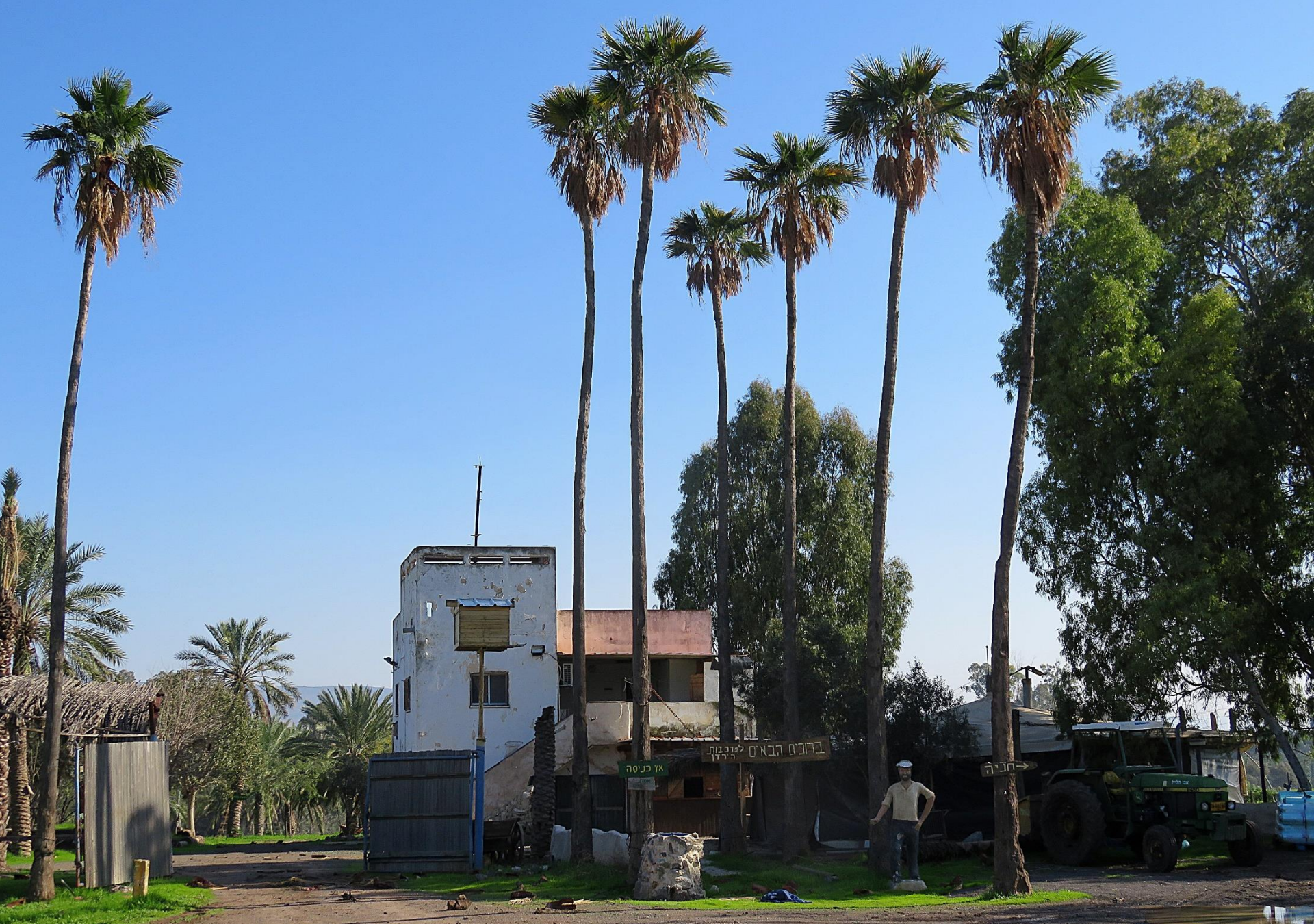
תחנה חמישית - ביתניה תחתית