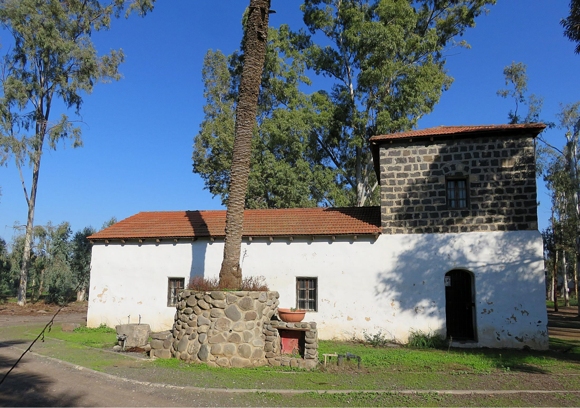
תחנה שמינית - בית המוטור