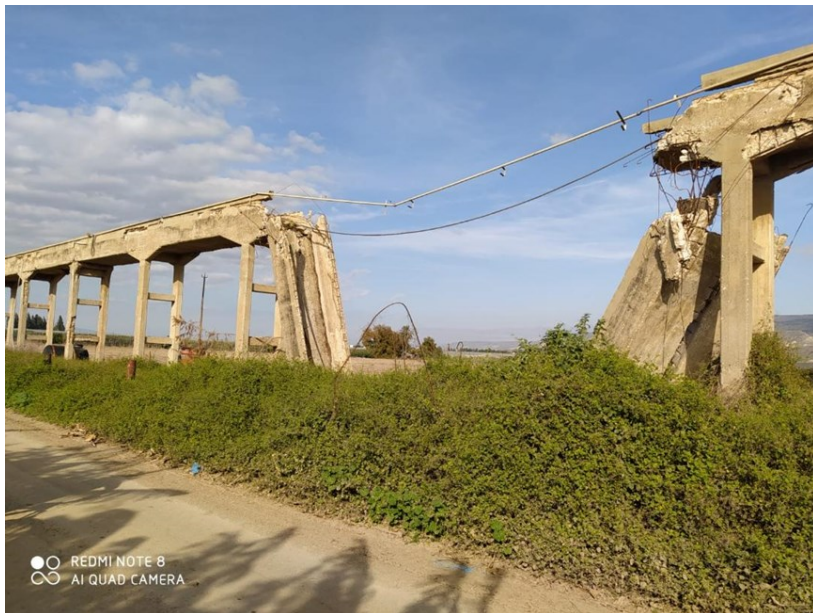
קריסת האקוודוקט בחודש דצמבר 2020.

רצה הגורל ומחלת הברושים שבעקבותיה נכרתו שדרות רבות בעמק הירדן החלה לפגוע גם בשדרת הברושים הצמודה לאקוודוקט וניתן האישור לכריתתה. כריתת השדרה חשפה את האקוודוקט במלוא הדרו מחד ופגמיו הרבים מאידך.