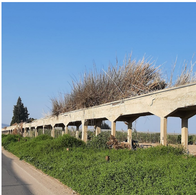
קנה צומח באמת המים