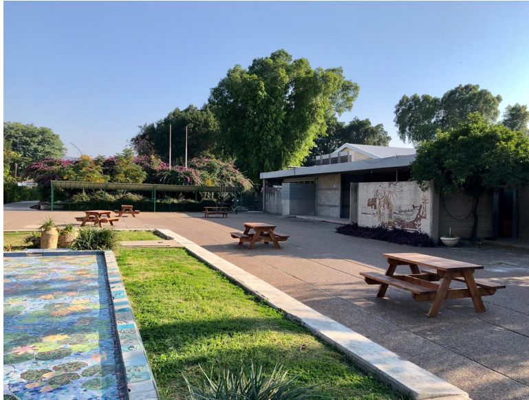
שולחנות לרווחת האוכלים מחוץ לחדר האוכל.