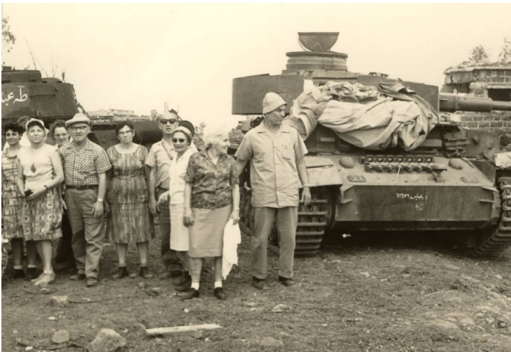
טיול חברים לרמת הגולן אחרי המלחמה. מצטלמים ליד טנק סורי

ב. על החברים להימנע מנסיעות בלתי הכרחיות מהבית. על כול נסיעה יש לקבל אישור ממרכזת ועדת החברה או ממרכז משק.