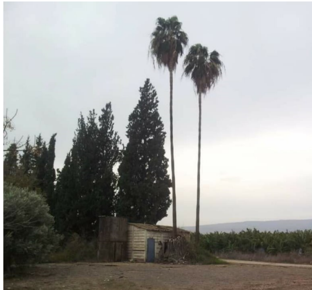
בימים הקרובים יהיה יום השנה לאלי ומכאן פרסום הסיפור

לאורית (רויטמן) ולקיבוץ אפיקים תודה רבה על קבלת הפנים והאירוח. תודה על השיחות המזדמנות בשבילים ועל הבעת הדאגה והאכפתיות. שנדע כולנו ימים שקטים ובטוחים.