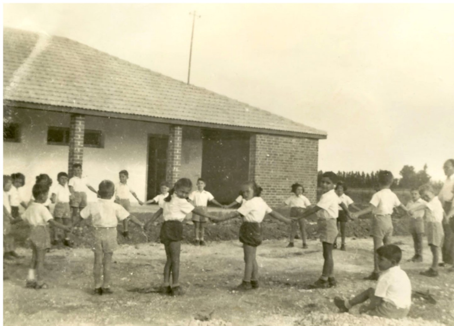
בית הספר אפיקים 1944

כי בית ספר הוא בית ילדותי בו למדתי לכתוב ולחשוב כי בית ספר הוא גם ידידי על הרע ועל הטוב.