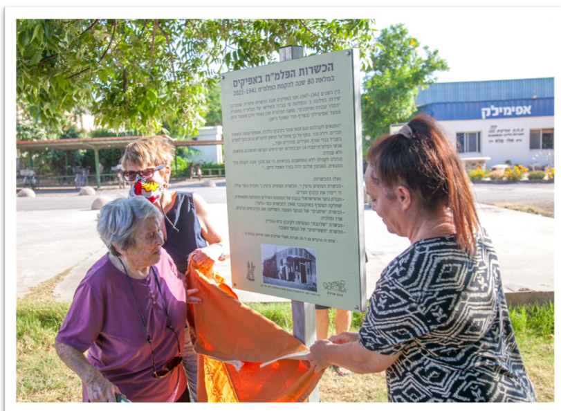
חשיפת השלט.