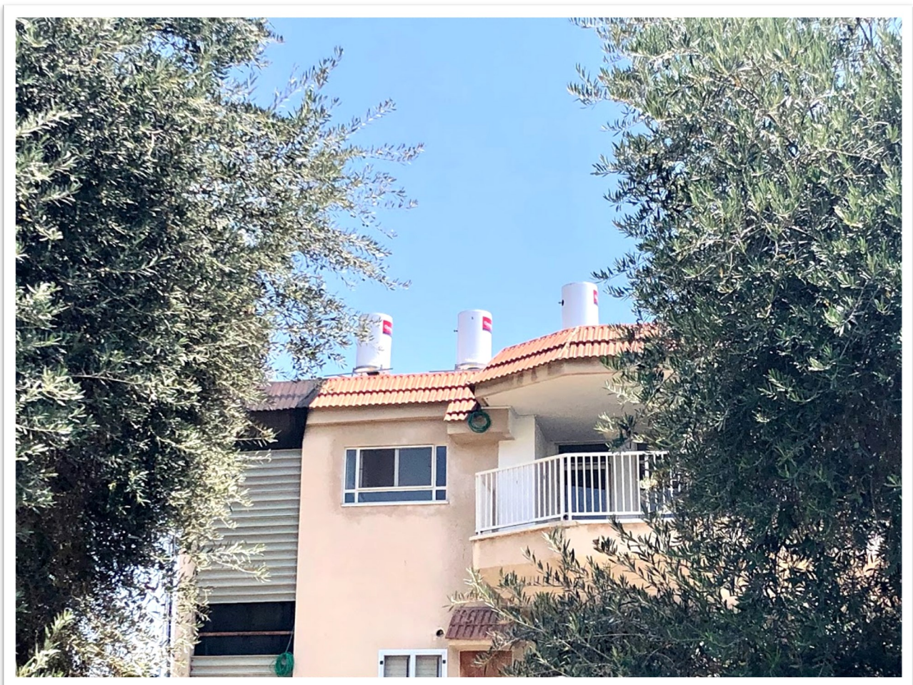
דודי שמש על גג בית 27