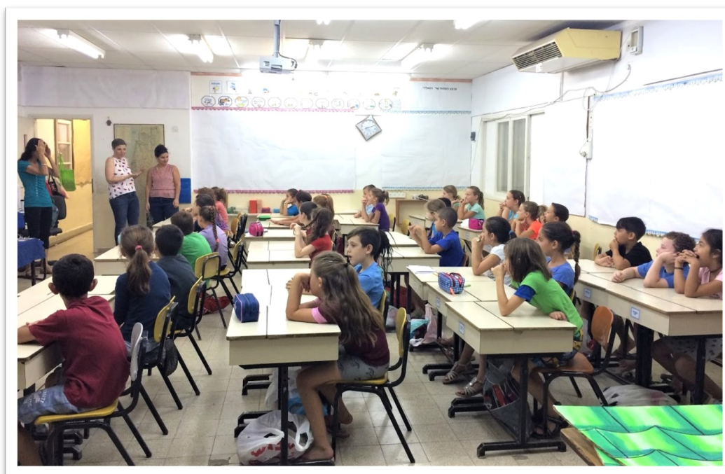
כיתה בבית הספר