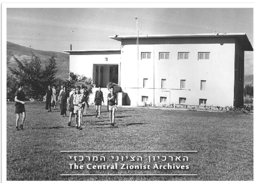
בית הטבע בבית הספר.