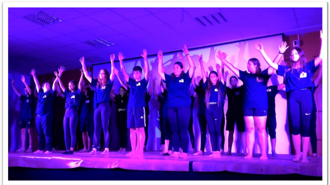
מתוך מסיבת הסיום של כיתה ח'

איך עוברות השנים ואנחנו בוגרים, מובילים את אפיקי ירדן, צל תמר, צלע הר, בית חם ומוכר - את הכל תמצא באפיקי ירדן!