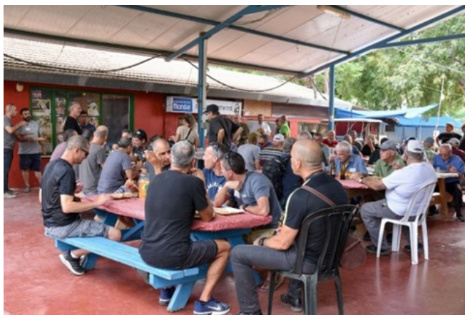
החבר'ה נהנים מהמטעמים הדרוזים והבירה