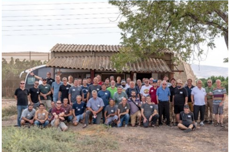
התמרנים ליד הסככה המיתולוגית בין חלקות "בני" ו"בארי"

הכלבים בכלביה כלל לא הספיקו להריח את ריח הקבבים, הפרגיות ושאר הריחות המשכרים שעלו מהמטעמים הדרוזים שחוסלו במהרה על ידי החבר'ה. כאלו הם התמרנים, גם באוכל הם מספר 1, גם כשמדובר בבירה קרה.