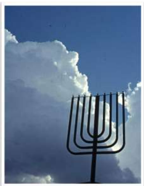
החננכיייה שעמדה על גג חדר האוכל הצפוני