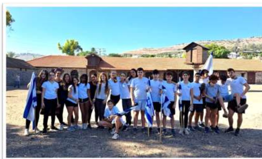
כיתה ח' בחצר כנרת לפני היציאה למירוץ הלפיד