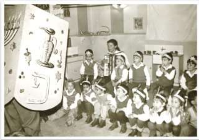
מסיבת חנוכה בגן רותה. 1967