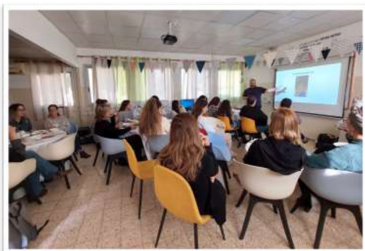
יום המורה באפיקי ירדן