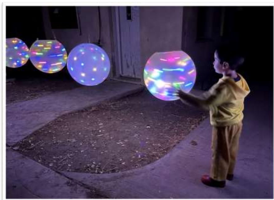
פסטיבל האור חנוכה תשפ"ב

זה מה שיש גם אתם הדליקו אש כך ביחד עם כולם נהפוך את העולם כן כן, זה הולך זה הולך לי ועוד איך בגללך ובגללך זה הולך.