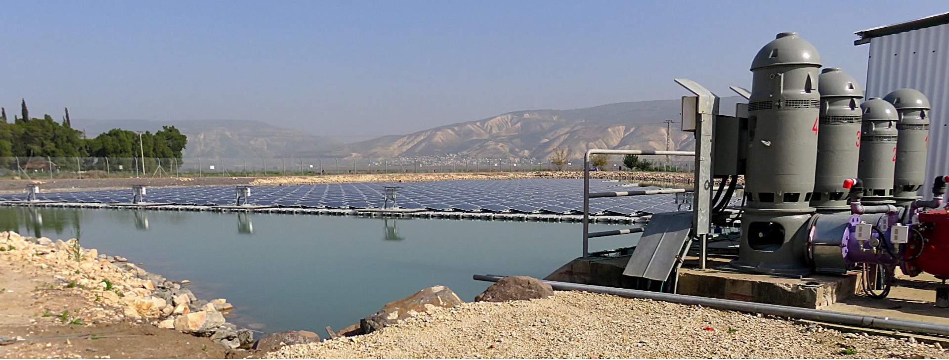
תאים סולאריים על בריכת מים