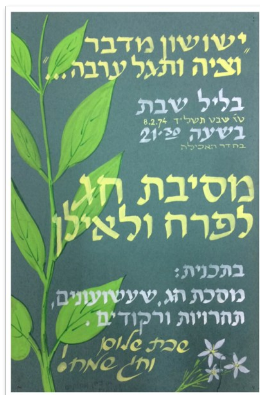
ברצת ט"ו בשבט מהארכיון. תשל"ד-1974