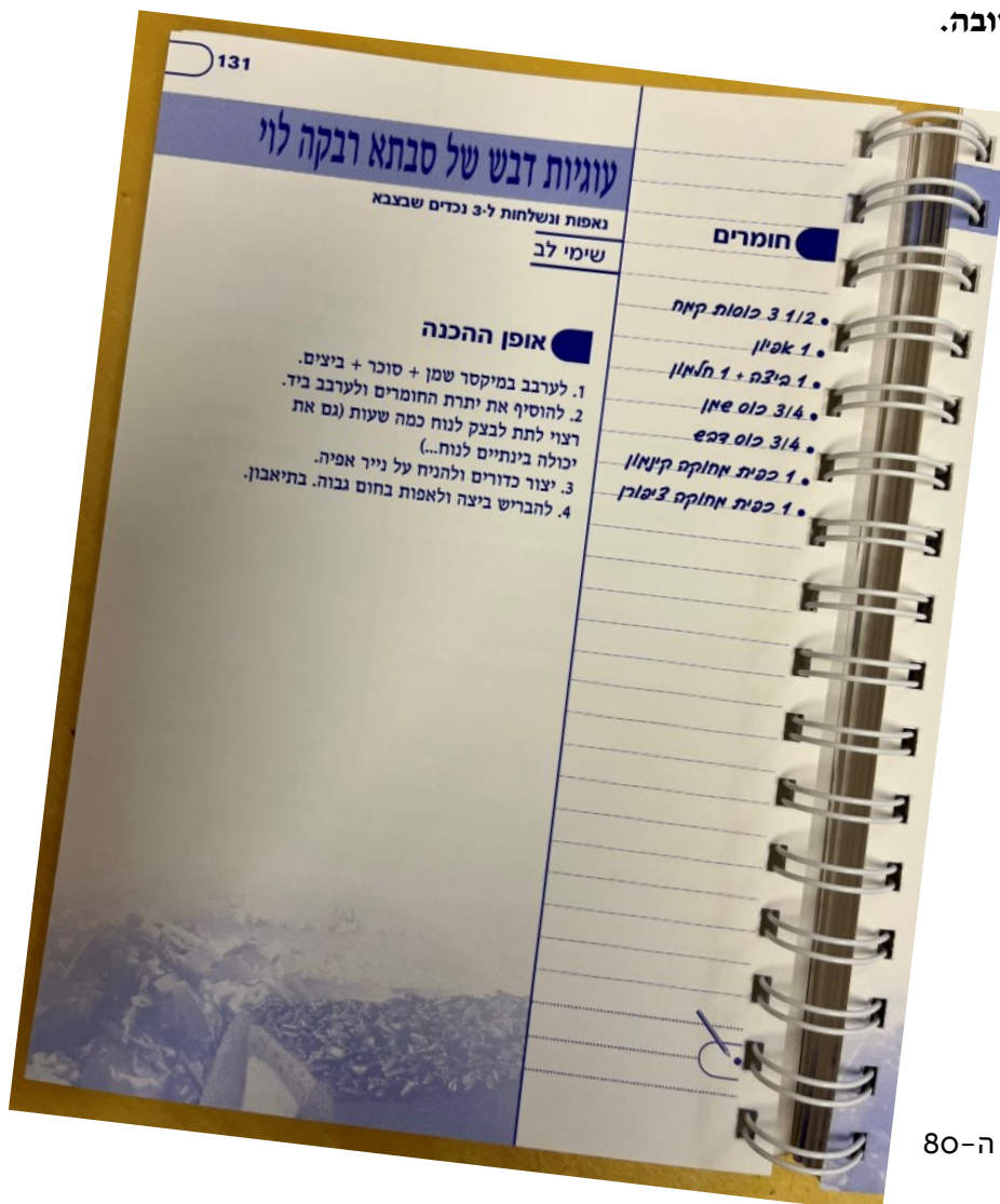
מתוך ספר המתבונים שיצא לחג ה-80 אוקטובר 2005