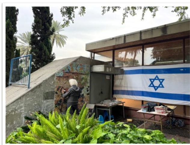
מקלט 32 צד דרום בתהליך עבודה