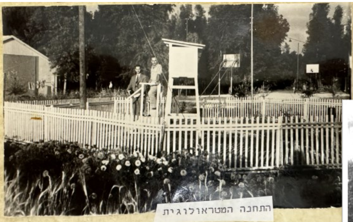
התחנה המטאורולוגית באפיקים