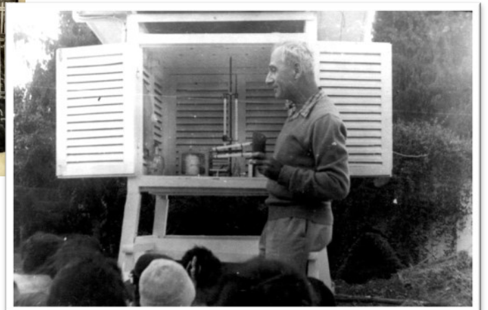
התחנה המטאורולוגית בבית גורדון