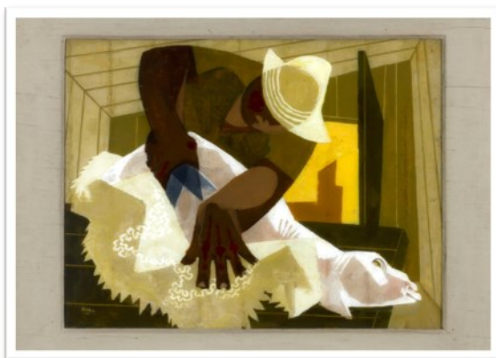
הגז, 1947 - שמן על פרספקס