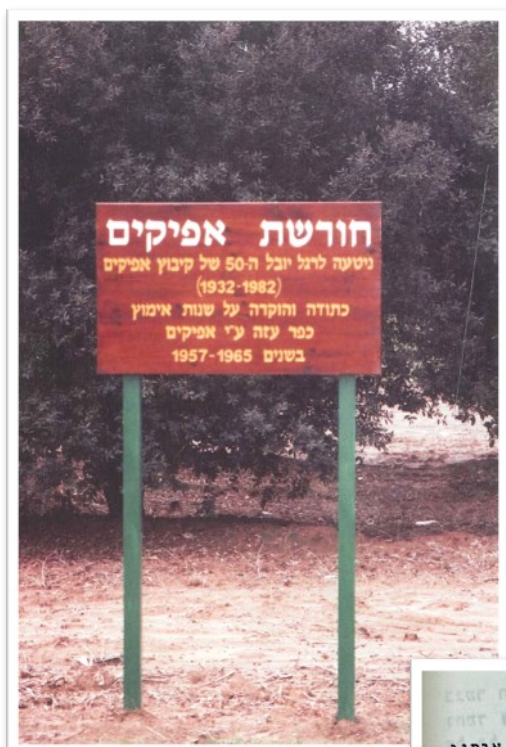
השלט בימים יפים - שנת 2007

ביום שישי 9.2 ביקר אבנר אביגדור בכפר עזה וצילם את השלט "חורשת אפיקים" כפי שמצא אותו וכתב: "החורשה כבר לא קיימת, מה שמדהים שהשלט היה זרוק הפוך ואני הפכתי אותו, כאילו שהוא קרא לי".