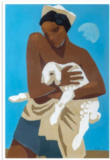
הרועה, 1949 - גואש על נייר