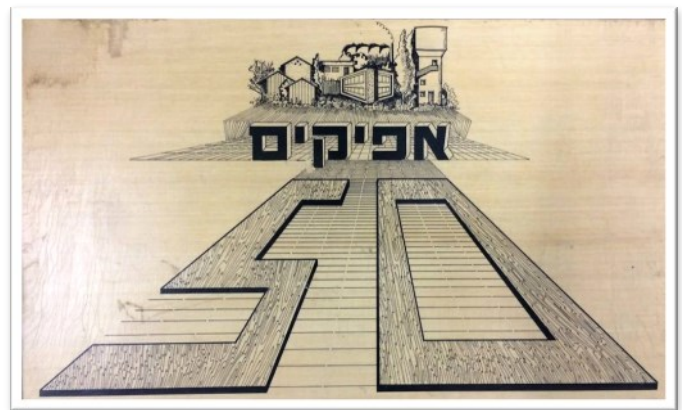
סמל אפיקים שעיצבה נורית דגאי לחגיגות היובל לעלייה לנקודה - 1982