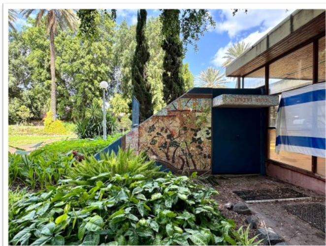
פרויקט קהילתי - פסיפס על מקלט 32 דרום, בהדרכת אסיה לשם