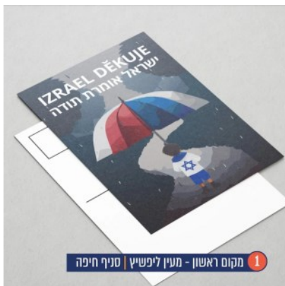
1 מקום ראשון - מעין ליפשיץ | סניף חיפה

ברכות חמות לעודד הירש על קבלת תואר פרופסור גאווה גדולה לך ולמשפחה ברכות מכולנו!