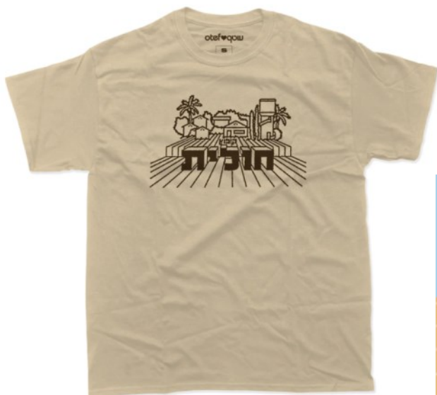
החולצה שפרויקט "עוטף" עיצבו לקיבוץ חולית, על בסיס הסמל של אפיקים