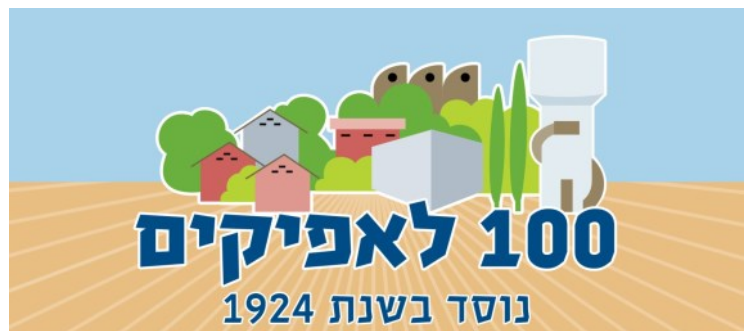
סמל אפיקים לכבוד שנת ה-100 לייסוד הקיבוץ. חידוש וצביעה: מאיה ואבי קלוסקי